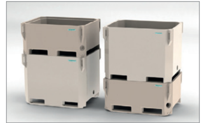
与赛海310升保温箱堆叠