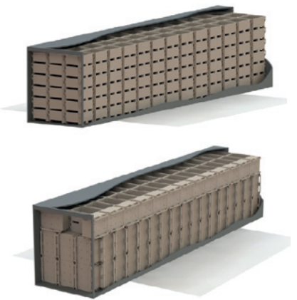
便捷运输 一辆40HC集装箱可装载244个赛海160升无盖保温箱