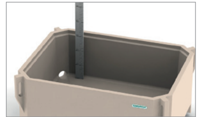
壁低有效减少对底部产品的挤压