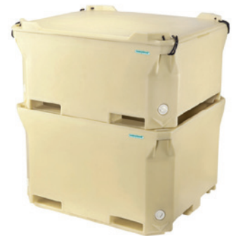
赛海460升和660升聚氨酯注泡保温箱可相互堆叠。