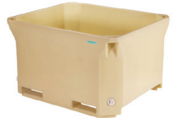
PUR 赛海660升聚氨酯注泡保温箱