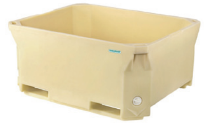
PUR 赛海460升聚氨酯注泡保温箱