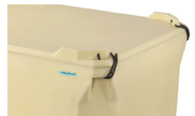
赛海460升和660升聚氨酯注泡保温箱可配备箱盖。