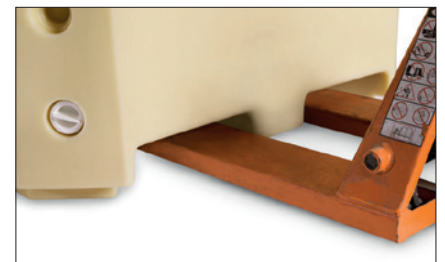
易配合液压车使用。