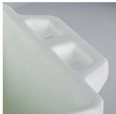
人性化的手柄设计