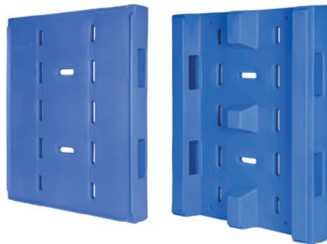
PUR 赛海 FVP 托盘 2S