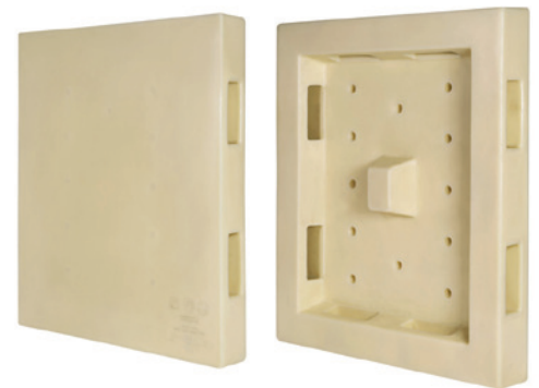
PUR 赛海 FPP 托盘 4S